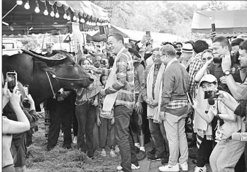
ผลิตภัณฑ์ : นายเศรษฐา ทวีสิน นายกรัฐมนตรี ร่วมโครงการ Thailand Buffalo Heritage โดยมี นายอรรถกร ศิริลัทธยากร รมช.เกษตรและสหกรณ์ พร้อมคณะ เข้าร่วม ที่ จ.พระนครศรีอยุธยา มุ่งยกระดับพัฒนา ผลิตภัณฑ์ควายไทย ให้เป็น Soft Power ระดับโลก สร้างมูลค่าเพิ่มให้ควายไทย และให้ดำรงอยู่กับวิถีเกษตรกรรมไทย