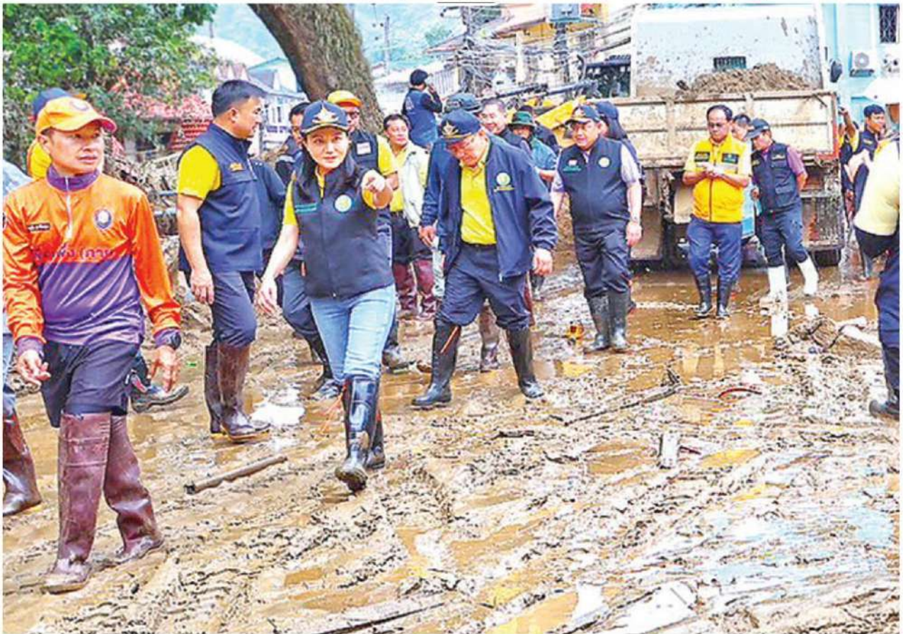
ลุยโคลน - น.ส.นฤมล ภิญโญสินวัฒน์ รัฐมนตรีว่าการกระทรวงเกษตรและสหกรณ์ นายอิทธิ ศิริลัทธยากร และนายอัครา พรหมเผ่า รัฐมนตรีช่วยว่าการกระทรวงเกษตรและสหกรณ์ ลงพื้นที่ติดตามสถานการณ์อุทกภัยในพื้นที่จังหวัดเชียงราย เมื่อวันที่ 21 กันยายน

ด้าน น.ส.ธีรรัตน์กล่าวว่า ช่วงที่ผ่านมาก็ได้ไปหลายที่ ได้ให้กำลังใจพูดคุยกับเจ้าหน้าที่ถึงปัญหาต่างๆ ได้รับมอบหมายจาก น.ส.แพทองธาร ชินวัตร นายกรัฐมนตรี ให้ดูแลประชาชนให้ได้ดีที่สุด การลงพื้นที่วันนี้ได้ไปดูบ้าน ดูถนนที่ยังเดินทางไม่สะดวกสบาย ตอนนี้นำเจ้าหน้าที่ทุกหน่วยงาน เข้ามารับทราบและปฏิบัติให้ความช่วยเหลือเป็น