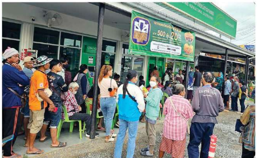
แห่ผูกพร้อมเพย - ประชาชนจำนวนมากมารอคิวเพื่อตรวจสอบสิทธิในการลงทะเบียนและผูกบัญชีพร้อมเพย ที่รัฐบาลจะเริ่มแจกเงิน 1 หมื่นบาท ให้กับกลุ่มเปราะบาง 14.5 ล้านคน ในวันที่ 25 กันยายน ที่อาคารเพื่อการเกษตรและสหกรณ์การเกษตร จนครราชสีมา เมื่อวันที่ 20 กันยายน

ของผู้มีสมาร์ทโฟนผ่านแอปพลิเคชัน ทางรัฐปัจจุบันมียอดทั้งสิ้น 36.4 ล้านคน ในจำนวนนี้มีหลายแสนคนลงทะเบียนเลขบัตรไม่ถูกต้องที่สำคัญมีถึง 2 ล้านคน ยังยืนยันตัวตนผ่านระบบเควายซี (KYC) ไม่สำเร็จ จึงขอแนะนำให้