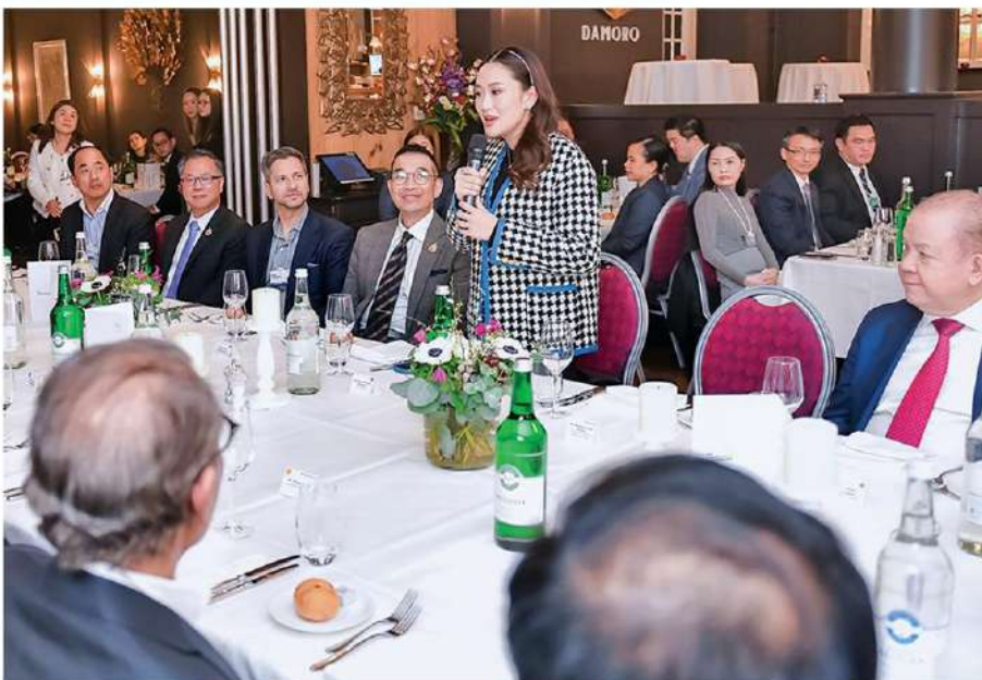
ดินเนอร์ - น.ส.แพทองธาร ชินวัตร นายกฯ ร่วมงาน Thailand Networking Dinner Reception ชอบคุณทีมไทยแลนด์ที่มุมเทจนประสบความสำเร็จในเวที World Economic Forum 2025 ที่ดาวอส สมาพันธ์รัฐสวิส เมื่อวันที่ 23 ม.ค. ตามเวลาที่องถิ่น

'อีง' โฮว์วิสัยทัศน์ส่งท้าย WEF เมื่อวันที่ 24 ม.ค. ผู้สื่อข่าวรายงานว่เวลา 15.00 น. วันที่ 23 ม.ค.ตามเวลาที่องถิ่นเมืองดาวอสซึ่งช้ากว่ากรุงเทพฯ 6 ชั่วโมงที่ศูนย์ประชุม Davos Congress Center เมืองดาวอส สมาพันธ์รัฐสวิส น.ส.แพทองธาร