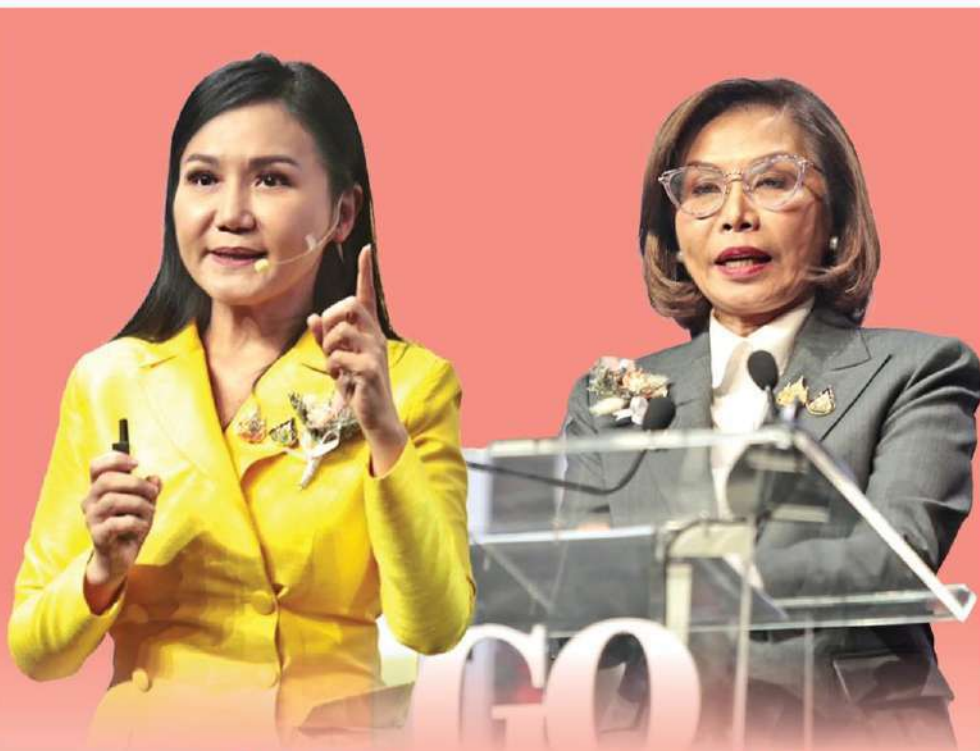
ศ.ดร.นฤมล กัญญาสินวัฒน์