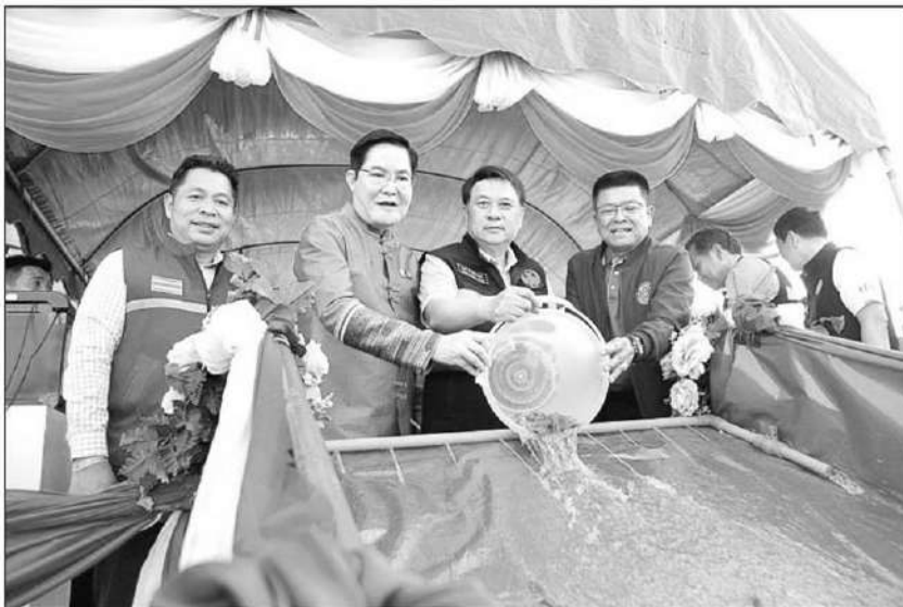
ปล่อยสัตว์น้ำ : นายอัครา พรหมเผ่า รมช.เกษตรและสหกรณ์ ร่วมปล่อยพันธุ์สัตว์น้ำโครงการบริหารจัดการทรัพยากรประมง เพื่อเพิ่มผลผลิตสัตว์น้ำในแหล่งน้ำชุมชน เพิ่มรายได้ ลดค่าครองชีพของประชาชน ที่บ้านใหม่ดอนชัย จ.เชียงใหม่ และขยายผลสู่ชุมชนอื่น รวมปล่อยพันธุ์สัตว์น้ำจืดเศรษฐกิจ ทั้งสิ้น 116.4 ล้านตัว

ด้านนายบัญชา สุขแก้ว อธิบดีกรมประมง กล่าวว่า มุ่งหวังว่าโครงการดังกล่าวจะช่วยแก้ปัญหาฝุ่น PM2.5 ได้อย่างจริงจัง และช่วยส่งเสริมเพิ่มรายได้ลดค่าครองชีพให้กับเกษตรกร ตลอดจนเพิ่มจำนวนประชากรสัตว์น้ำประจำถิ่นในธรรมชาติและสัตว์น้ำที่ไม่สามารถหาพื้นที่เหมาะสมตามธรรมชาติในช่วงฤดูผสมพันธุ์และวางไข่ได้ ช่วยคืนความอุดมสมบูรณ์ให้ชุมชนและสร้างแหล่งอาหารโปรตีน