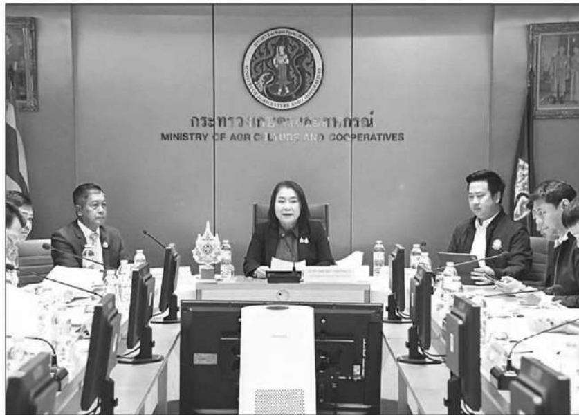
ประชุม : ดร.ฉมนิตา กลับบ้านเกาะ ผู้ช่วยรัฐมนตรีประจำกระทรวงเกษตรและสหกรณ์ ประชุมคณะกรรมการติดตามและขับเคลื่อนงานด้านการเกษตรฯ ครั้งที่ 2/2568 โดยติดตามการดำเนินงานต่างๆ ทั้งการแก้ปัญหาปลาหมอหางดำ การแก้ปัญหาทุเรียนข้ามสีที่ส่งออกไปจีน การแก้ปัญหามะพร้าว ในมะพร้าว

นอกจากนี้ ที่ประชุมได้หารือแนวทางการแก้ไขการระบาดหนอนหัวดำในมะพร้าว ซึ่งกรมส่งเสริมการเกษตร มีแนวทางการขับเคลื่อนภารกิจผ่าน 5 มาตรการ ดังนี้ 1) การสร้างการรับรู้ เพื่อพัฒนาศักยภาพและสร้างความเข้าใจในการจัดการศัตรูมะพร้าวให้แก่เกษตรกร 2) การเฝ้าระวังและแจ้งเตือนภัย โดยจะมีรายงานสถานการณ์การระบาดผ่านทางเว็บไซต์ และช่องทางทางติดต่อของหน่วยงาน 3) การป้องกันและควบคุมการระบาด เพื่อกำจัดเขตการระบาดไม่ให้ขยายวงกว้าง ซึ่งปัจจุบัน