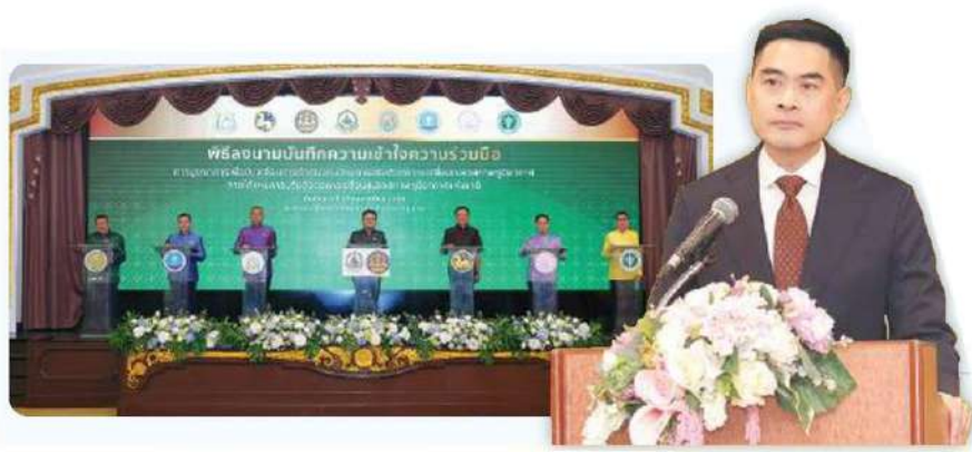
ดร.พิรุณ สัยยะสิทธิ์พานิช

เปลี่ยนแปลงสภาพภูมิอากาศในทุกประเทศ อธิบดีกรมลดโลกร้อน ย้ำว่าการปรับปรุงแผนแม่บทรองรับการเปลี่ยนแปลงสภาพภูมิอากาศในครั้งนี้ ให้ความสำคัญกับการเสริมสร้างความสามารถในการเข้าถึงแหล่งทุนระหว่างประเทศ และการออกแบบมาตรการสนับสนุนทางการเงินที่เหมาะสมกับบริบทของประเทศไทย เพื่อให้แผนแม่บทฯ ฉบับปรับปรุงนี้