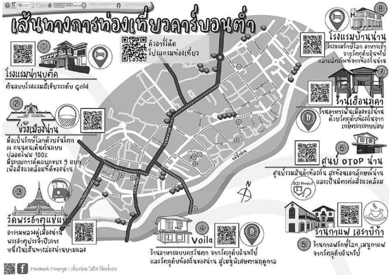
ภาพที่ 2 เส้นทางท่องเที่ยวคาร์บอนต่ำ รวบรวมโดยคณะผู้วิจัย

หัวข้อข่าว: การท่องเที่ยวคาร์บอนต่ำ (Low Carbon Tourism)