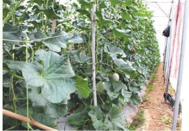
แปลงทดสอบการใช้ผลิตภัณฑ์ พด.16 แบบที่เรียกควบคุมไส้เดือนฝอยรากปม ในเมล่อน