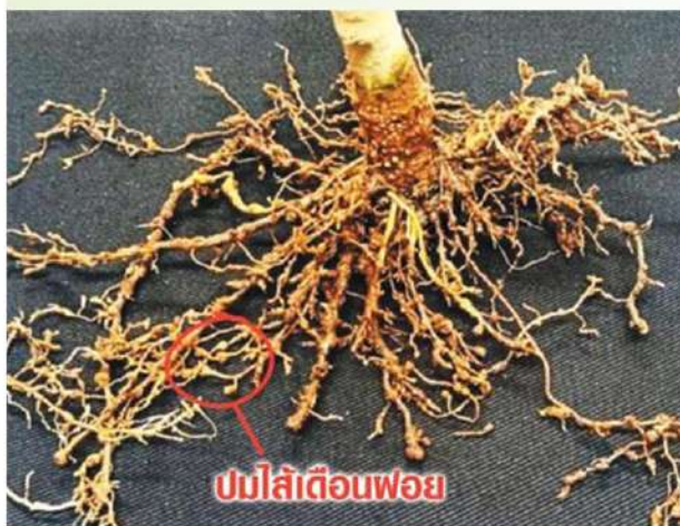
ปมรากที่เกิดจากไส้เดือนฝอยรากปม