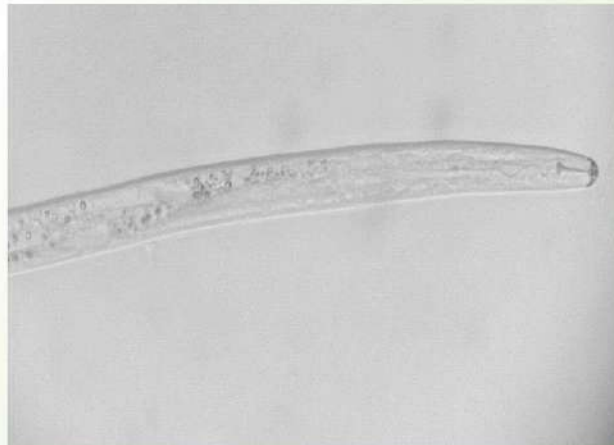
ไส้เดือนฝอยรากปม

ราก และไส้เดือนฝอยรากปมยังสามารถแพร่ระบาดได้ดีไปกับระบบการให้น้ำ รวมทั้งเกาะติดไปกับดินเพาะกล้า และเครื่องมือการเกษตร ไส้เดือนฝอยรากปมมีวงจรชีวิตเพียง 15 – 20 วัน เท่านั้น อีกทั้งยังเพิ่มจำนวนได้อย่างรวดเร็ว นอกจากนี้ยังเป็นศัตรูพืชที่สร้างแผลบริเวณราก ส่งผลให้เชื้อราสาเหตุโรคอื่นๆ เช่น Fusarium oxysporum สาเหตุโรคเหี่ยวของมะเขือเทศสามารถเข้าทำลายซ้ำเติม (secondary infection) ผ่านทางบาดแผลของไส้เดือนฝอยศัตรูพืช ส่งผลให้ผลผลิตมะเขือเทศเสียหายเพิ่มมากขึ้น ดังนั้นจึงสามารถก่อให้เกิดความเสียหายทางเศรษฐกิจกับพืชได้