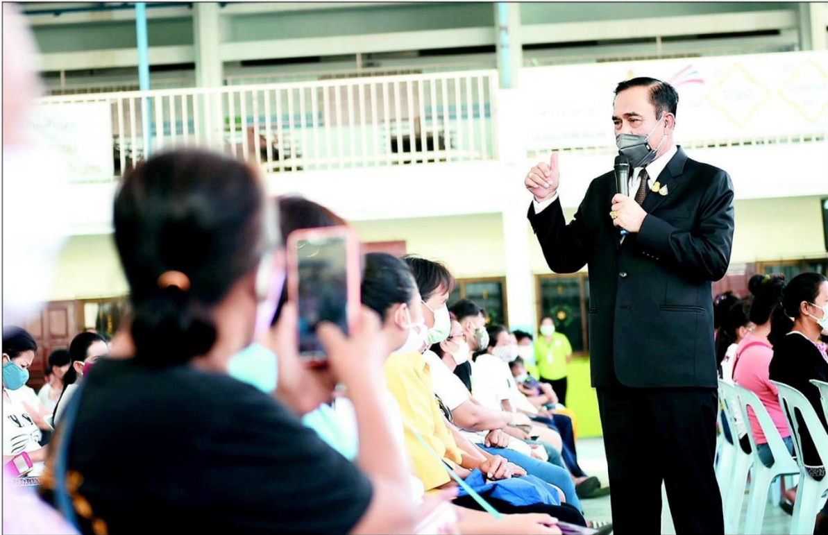
พล.อ.ประยุทธ์ จันทร์โอชา นายกรัฐมนตรีและ รมว.กลาโหม ในฐานะผู้อำนวยการ ศบค.ลงพื้นที่ตรวจเยี่ยมศูนย์ช่วยเหลือผู้ได้รับผลกระทบจากการแพร่ระบาดของโรคโควิด-19 พร้อมติดตามการบริหารจัดการของโรงงาน ที่วัดระฆังโฆสิตารามวรมหาวิหาร เขตบางกอกน้อย กรุงเทพฯ

วันพฤหัสบดีที่ 14 พฤษภาคม พ.ศ. 2563 ฉบับที่ : 8585 หน้า : 1(กลาง), 10