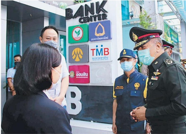
▲ ลิงพื้นที่ พล.อ.พรพิพัฒน์ เบญญศรี ผบ.ทหารสูงสุด พูดคุยกับเจ้าหน้าที่ชุดตรวจร่วมที่ห้างสรรพสินค้าแห่งหนึ่งใน จ.ชลบุรี ขณะตรวจเยี่ยมการปฏิบัติด้านตรวจคัดกรองของด่านควบคุมโรคโควิด-19 หลังผ่อนปรนมาเกือบ 2 อาทิตย์.