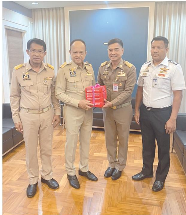
แสดงความยินดี...ยุทธินันท์ สุวรรณอำไพ ปลัดเทศบาลเมืองสระบุรี แสดงความยินดี กับ ดร.ทองเปลว กองจันทร์ ในโอกาสได้รับโปรดเกล้าฯ ดำรงตำแหน่ง ปลัดกระทรวงเกษตรและสหกรณ์