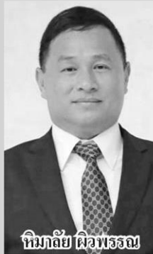
หิมาลัย ผิวพรรณ

ทับซ้อนระหว่างกระทรวงเกษตรฯ กับกระทรวงทรัพยากรฯ