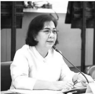
ทัศนีย์ เมืองแก้ว