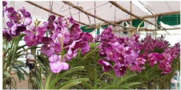
นายธานี รัตนานันท์ รัฐมนตรีว่าการกระทรวงเกษตรและสหกรณ์ (ตชช.) พร้อมด้วย ดร.เฉลิมชัย ศรีอ่อน รัฐมนตรีว่าการกระทรวงพาณิชย์ ได้เดินทางไปตรวจเยี่ยมเกษตรกรผู้ปลูกกล้วยไม้ไทย ณ ศูนย์รวมเกษตรกรผู้ปลูกกล้วยไม้ไทย ณ ตำบลบ้านกล้วย อำเภอเมือง จังหวัดพิษณุโลก