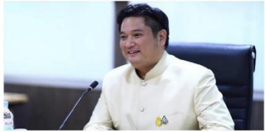
นายธานี รัตนานันท์ รัฐมนตรีว่าการกระทรวงเกษตรและสหกรณ์ (ตชช.) พร้อมด้วย ดร.เฉลิมชัย ศรีอ่อน รัฐมนตรีว่าการกระทรวงพาณิชย์ ได้เดินทางไปตรวจเยี่ยมเกษตรกรผู้ปลูกกล้วยไม้ไทย ณ ศูนย์รวมเกษตรกรผู้ปลูกกล้วยไม้ไทย ณ ตำบลบ้านกล้วย อำเภอเมือง จังหวัดพิษณุโลก