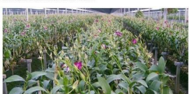
นายธานี รัตนานันท์ รัฐมนตรีว่าการกระทรวงเกษตรและสหกรณ์ (ตชช.) พร้อมด้วย ดร.เฉลิมชัย ศรีอ่อน รัฐมนตรีว่าการกระทรวงพาณิชย์ ได้เดินทางไปตรวจเยี่ยมเกษตรกรผู้ปลูกกล้วยไม้ไทย ณ ศูนย์รวมเกษตรกรผู้ปลูกกล้วยไม้ไทย ณ ตำบลบ้านกล้วย อำเภอเมือง จังหวัดพิษณุโลก