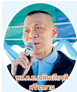
พล.ต.อ.เจลินเกียรติ ศิริวชาน

จัดการธนาคารที่ดิน กล่าวว่า ในช่วง 5 ปีที่ผ่านมา (พ.ศ. 2559-2563) ได้ดำเนินการแก้ไขปัญหาดินทำกินให้เกษตรกรไปแล้ว 1,369 ครัวเรือน รวมเป็นพื้นที่ทั้งหมด 5,066-1-04.2 ไร่ โดยผ่านการดำเนินงานของ บจธ. ใน 4 โครงการ คือ 1. โครงการบริหารจัดการที่ดินอย่างยั่งยืน เป็นการให้ความช่วยเหลือกลุ่มเกษตรกร ที่ไม่มีที่ดินทำกินเป็นของตนเอง ให้มีที่ดินทำกินและได้ประกอบอาชีพเกษตรกรรมได้อย่างยั่งยืน โดยกลุ่มต้องจัดตั้งเป็นวิสาหกิจชุมชนหรือกลุ่มสหกรณ์ และมองหาที่ดินที่ต้องการใช้ประโยชน์ในรูปแบบกรรมสิทธิ์แบบแปลงรวม บจธ. จะเป็น