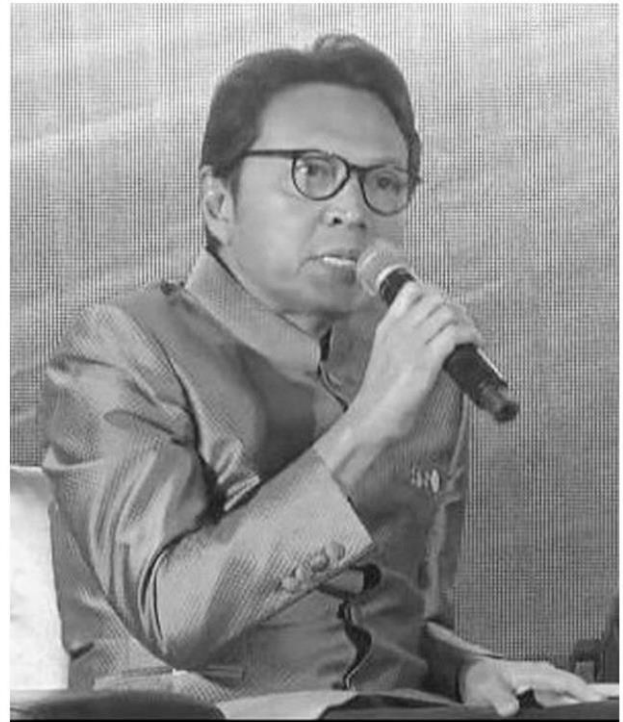
ชเนศวร์ เพชรสุวรรณ รองผู้อำนวยการท่องเที่ยวแห่งประเทศไทย

แล้วใช้การเจรจาผ่านช่องทางออนไลน์ ทั้งนี้ เชื่อกันว่าปี 2564 การส่งออกน่าจะดีขึ้น โดยคาดการณ์ไว้ที่เป็นบวกร้อยละ 4 จากปัจจัยเศรษฐกิจโลกที่เริ่มดีขึ้น ทั้งสหรัฐอเมริกา และองค์การเพื่อความร่วมมือและการพัฒนาทางเศรษฐกิจ (OECD) ก็คาดการณ์ไว้ที่บวกร้อยละ 4 เช่นกัน