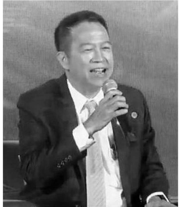
บุญฤทธิ์ กัลยาณมิตร ปลัดกระทรวงพาณิชย์

เรื่องการท่องเที่ยว การท่องเที่ยวเวลามากกลับมาเร็วมาก เรายังมีคนละครั้งในช่วงไตรมาสแรก อันนี้ก็จะจะมีเม็ดเงินลงไป 6 หมื่นล้านบาท