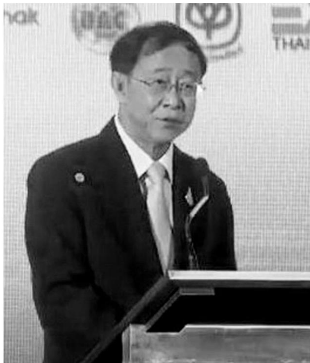
อาคม เดิมพิทยาไพสิฐ รัฐมนตรีว่าการกระทรวงการคลัง

แค่ 3% วันนี้อัตราเข้าพัก จนถึง 17 ธ.ค. 2563 หรือ 22 ธ.ค. 2563 คือ 30% ดีขึ้นมามาก มีผู้เข้าร่วมโครงการของรัฐบาล เทียบด้วยกันด้วย แล้วก็ประชาชนคนไทยเข้าใจดีว่าผู้ประกอบการโรงแรมเดือร้อนและยังประสบกับความยากลำบาก ไปช่วยเหลือกัน พูดกันปากต่อปากให้ไปเที่ยวไทย แล้วก็ประสบความสำเร็จจริงๆ” สุพัฒนพงษ์ กล่าว