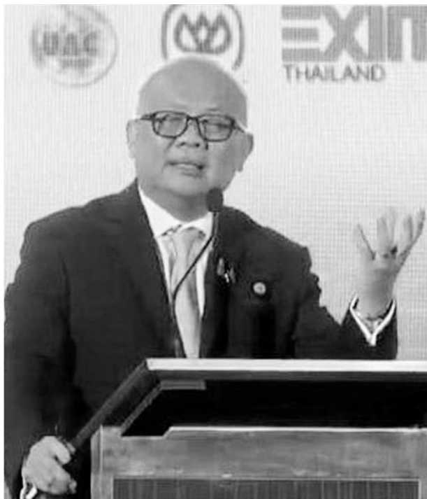
สุพัฒนพงษ์ พันธ์มีเชาว์ รองนายกรัฐมนตรี และรมว.พลังงาน