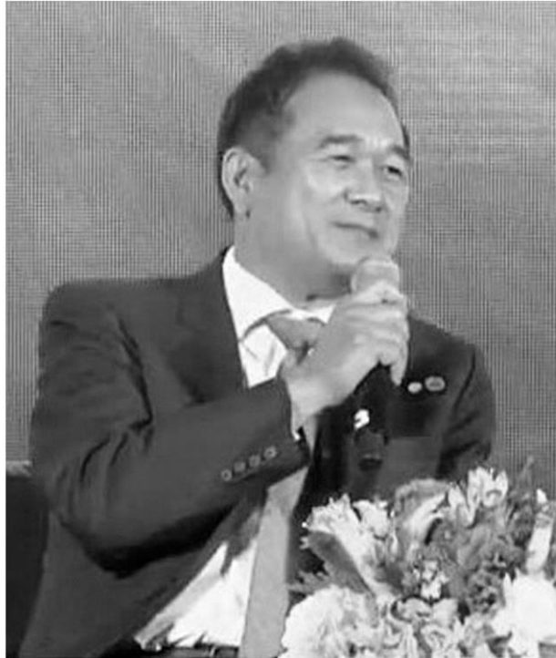
กฤษฎา จีนะวิจารณ์ ปลัดกระทรวงการคลัง