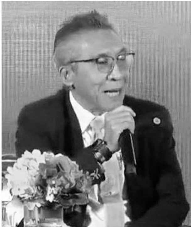
ภานุวัฒน์ ตรียางกูรศรี รองปลัดกระทรวงอุตสาหกรรม