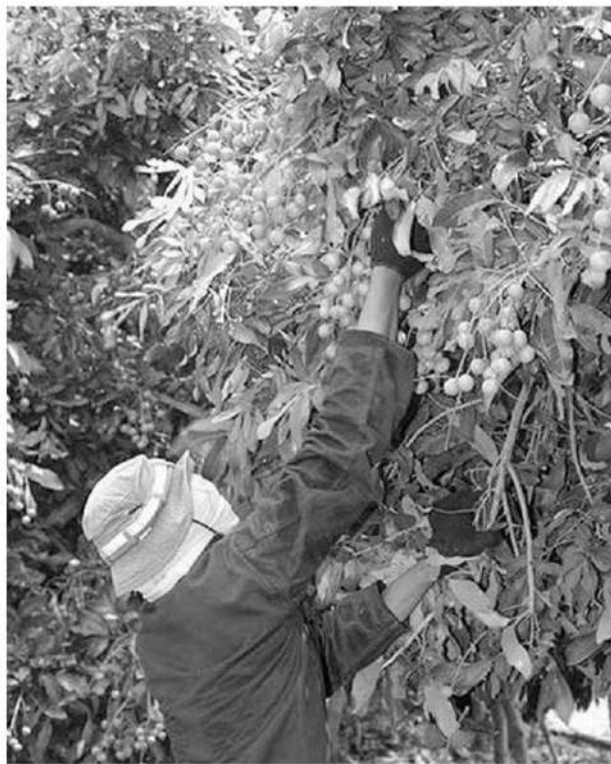
และหากรัฐยังแก้ไม่ได้เชื่อว่าตลาด ผลไม้ไทยมีปัญหาแน่" ดร.รัฐวิทย์ กล่าว.

หัวข้อข่าว: นายกส.คำชายแดนฯชี้ แก้ปัญหาส่งออกผลไม้ไปจีนไม่ได้เสียหายนับหมื่นล้านบาท