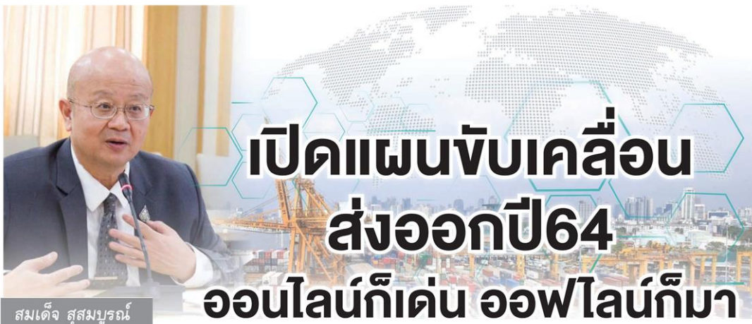
สมเด็จ สุสมบูรณ์