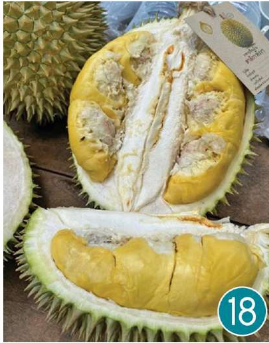
หรอยแรง 'ทุเรียนสาธิตกา' ของดีพังงา ราชทุเรียนบ้าน